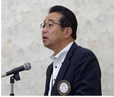
阿川財団委員長 11月は財団月間です。 皆様の寄付を宜しく申し上げます