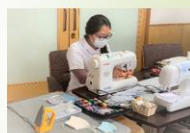
マスクの種類 (生地やサイズが異なる種類)