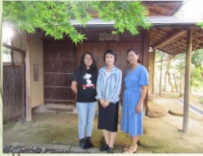
教育熱心のご家族です